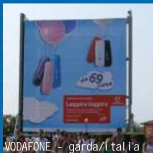
VODAFONE - garda/italia