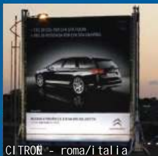
CITROËN - roma/italia