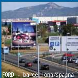
FORD - barcelona/spagna