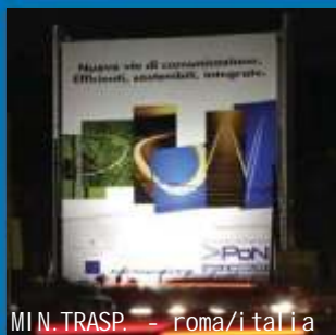
MIN. TRASP. - roma/italia